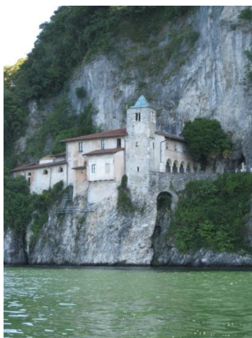
Felsenkloster S. Catarina del Sasso